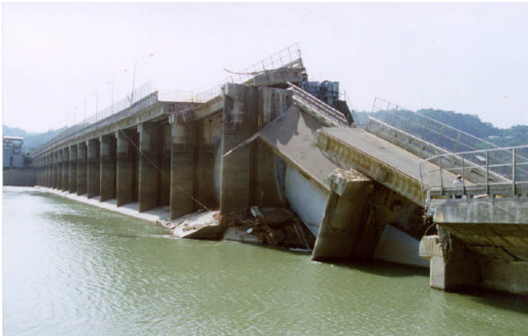
圖 6.1 由上游面檢視石岡壩的破壞情形

集集大地震對於水庫、水壩及攔河堰所造成的損壞，除了大甲溪流域的石岡壩遭到嚴重的破壞外，其餘的受損狀況則尚屬輕微。石岡壩的詳細受損情形如圖 6.1 所示。